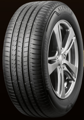
ยางนำเข้า