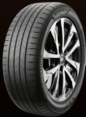
ผลิตในประเทศ

* ผลิตในประเทศ ** ยางนำเข้า หมายเหตุ : XL (Extra Load) = ยางโครงสร้างแข็งแรงพิเศษ : RFT (ยางRunFlat)